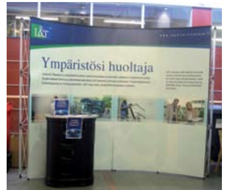
L&T esittäytyi kauppakeskus Revontulesa Rovaniemellä.

EFM Suomi Oy ja L&T järjestävät vastaavan tapahtuman ensi vuonna myös muissa EFM:n kauppakeskuksissa. L&T tuottaa EFM:lle L&T Kauppakeskus -palvelumallin mukaista palvelua kauppakeskus Revontulen lisäksi Helsingin Kampissa, Riihimäen Atomissa ja Lappeenrannan Galleriassa.