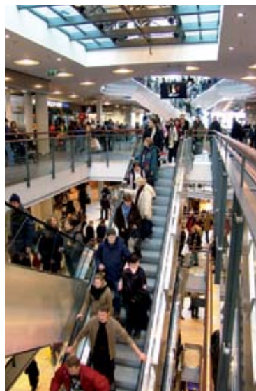
Kampin kauppakeskuksessa on 40 000 neliometriä vuokrattavaa liiketilaa, joissa toimii 150 yritystä.

Koulutuksiin ilmoittaudutaan sähköpostilla osoitteeseen *Pks:n SP Koulutus viikkoa ennen koulutusajankohtaa. Ilmoituksesta on käytävä ilmi osallistujan nimi ja kustannuspaikka.