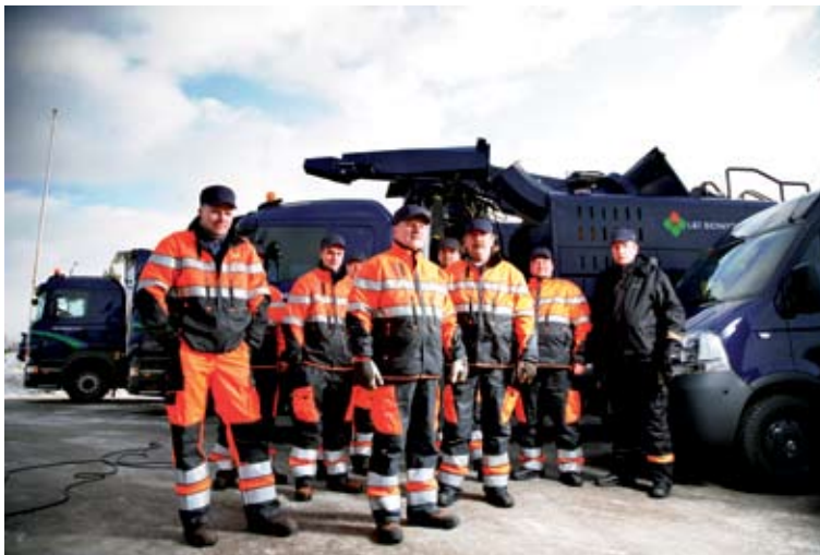
Biowattilaiset näkyvät kauas.

ti. Selvää on myös se, että korjaamon väki käyttää suojaimia ja toimii huolellisesti.