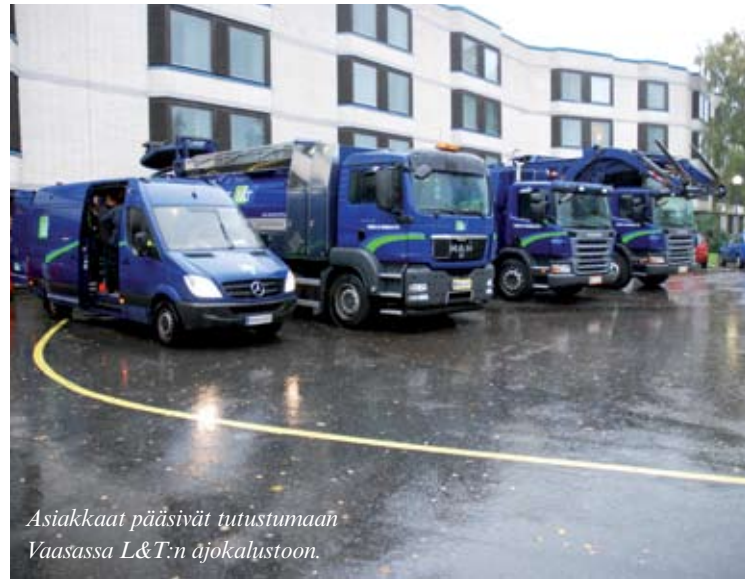
Asiakkaat pääsivät tutustumaan Vaasassa L&T:n ajokalustoon.

Vuosittain järjestettävässä yhteistoimintaharjoituksessa VSA-happilaitoksella tapahtui kuvitteellinen happivuotoon liittyvä onnettomuus. Harjoituksen jälkeen pidettiin palautetilaisuus, jossa eri pisteissä toimineet tarkkailijat kävivät havaintojaan läpi. Kehityskohteita löytyi runsaasti. Muun muassa yhteistyötä on vielä kehitettävä, tilannejohtamisessa tarvitaan lisää jämäkkyyttä ja vaarallisten aineiden tuntemuksessa sekä tiedonkulussa on parannettavaa.