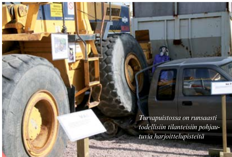
Turvapuistossa on runsaasti todellisiin tilanteisiin pohjautuvia harjoittelupisteitä

Puiston omistaa rakennusmateriaaliyrittäjä Rudes, jonka yhteistyökumppanina on L&T. Turvapuistoa tullaan hyödyntämään myös L&T:n työturvallisuuskoulutuksissa.