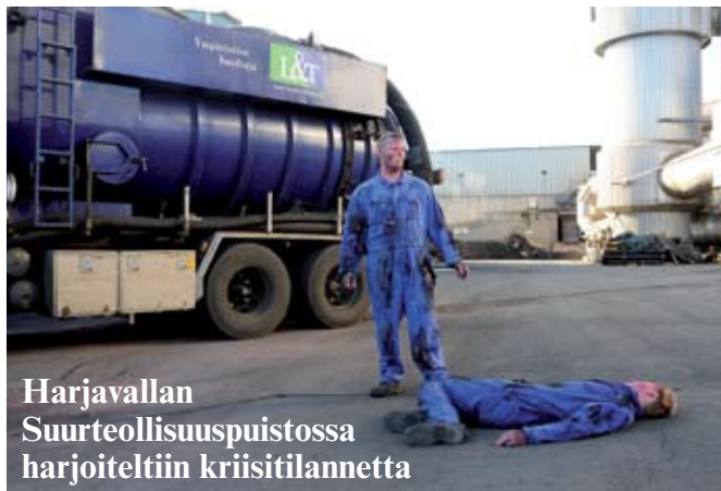
Harjavallan Suurteollisuuspuistossa harjoiteltiin kriisitilannetta